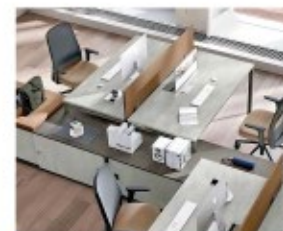
MOBILIARIO DE OFICINA