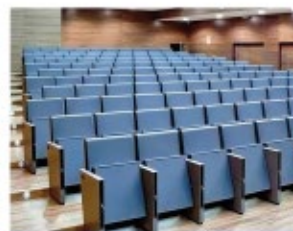
AUDITORIOS Y ESCENARIOS

Contamos con un showroom en Quito, un edificio corporativo en Guayaquil, y una planta industrial moderna en Durán, lo que nos permite impulsar grandes proyectos y responder a los requerimientos más exigentes en todo el Ecuador.