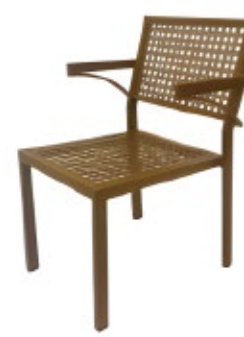
DELTA - A