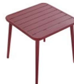
CAMP - 4