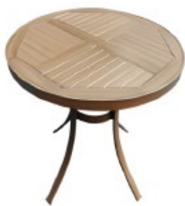
PHIME - A