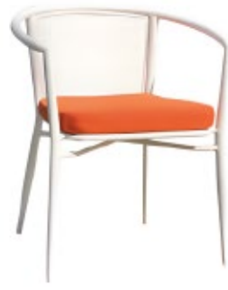
NÁCAR - A