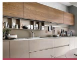
ANAQUELES Y COCINAS