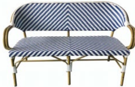
MART - 2