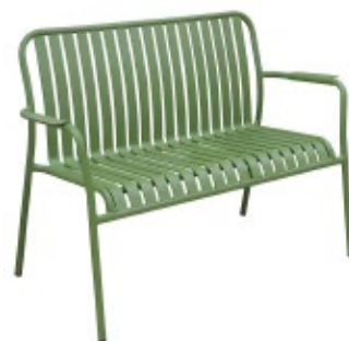
FRANJ - B