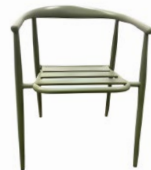
MARÉ - A