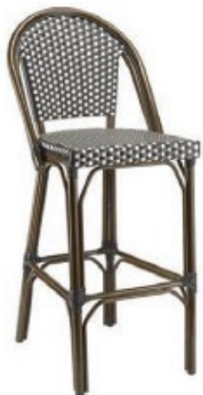
SATU - T