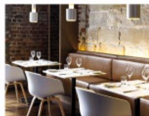
RESTAURANTES Y HOTELES