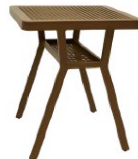
MIMB - A