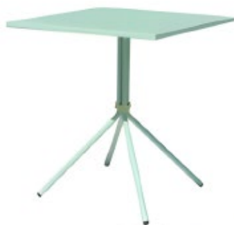
ALBA - A