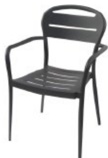
BOREO - A