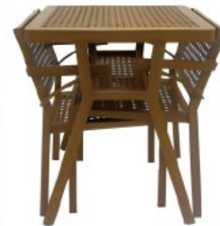
REPOS - A