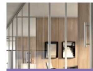
DIVISIONES Y PANELERÍA